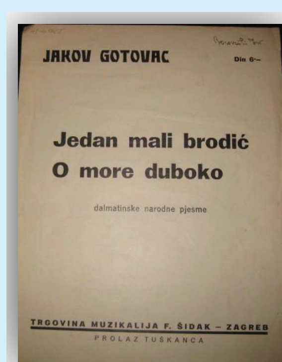
Slika 10.

Sadržaj zbirke prikazivao bi tekst koji opisuje povijesne događaje u životu skladatelja, odabrane rukopise koji predstavljaju jedinstveni trenutak nastanka sadržajnih momenta na području solo popijevki te uvid u individualan skladateljski Opus kao važan dio glazbene baštine. Kreiranjem odabranog sadržaja digitalne zbirke nastaju datoteke koje se pohranjuju u određenim formatima, a zatim slijedi oblikovanje pristupa digitalnoj zbirci u programskoj okolini digitalne knjižnice.