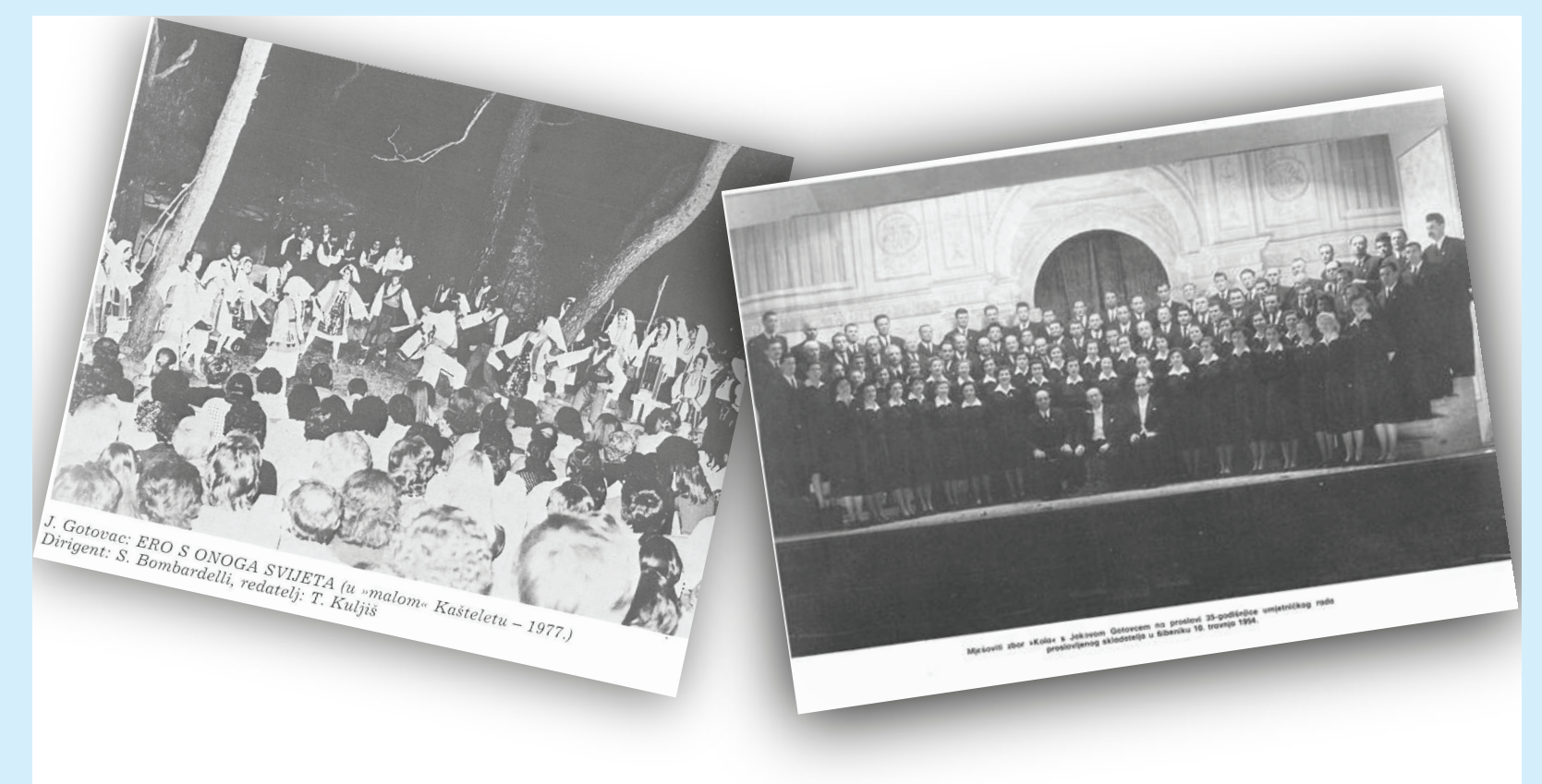
Slika 4. Izvor: Kuljiš, T. Koncertni život u Splitu i Dalmacijakoncert: o povodu 40-godišnjice prve koncertne poslovnice i 20-godišnjice rada Dalmacijakoncert-a: [1948. – 1988.] / Tomislav Kuljiš; fotografija Lj. Garbin, V. Radatović, S. Simić. Split: Dalmacijakoncert, 1988.