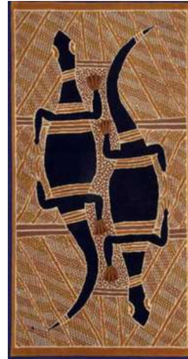
Krivotvoreni tepih tvrtke Indofurn Pty Ltd koji sadrži sliku Banduk Marike Djanda and the Sacred Waterhole 1995. Sintetski obojena vuna, 201 x 101 cm.