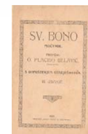
SVETI BONO MUČENIK PLACIDA BELAVIĆ

Digitalna zbirka dostupna na: http://gkvu.hr/category/digitalna-zbirka/