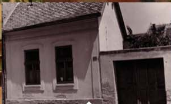
Djetinjstvo u Vukovaru - 1867