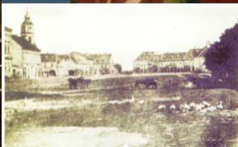
Gimnazija u Osijeku (1879. – 1887.) - 1879

Od 1879. do 1887. pohađao je Klasičnu gimnaziju u Osijeku. Već sam prvi razred osječke gimnazije svršio kao 'prvi' i najbolji đak pošto su u ono doba (oko 1879.) đaci ...