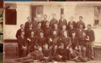
Život gimnazijalca - 1885