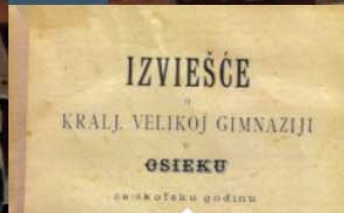
Ispit zrelosti - 1887