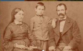
Vukovarska pučka škola - 1874