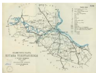
KILOMETRIČKA KARTA KOTARA VUKOVARSKOGA