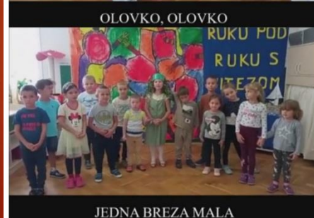
JEDNA BREZA MALA