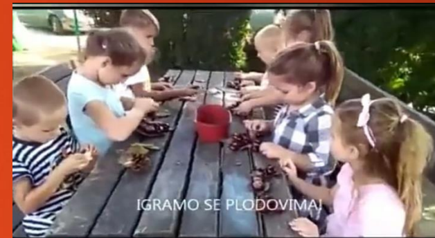
Kad bi drveće hodalo

Multimedijalni projekt Mjesec hrvatske knjige 15.10.-15.11. 2020.