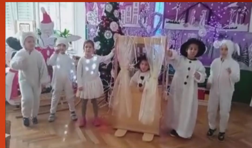
Božić kuca na vrata