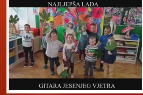
GITARA JESENJEG VJETRA