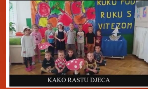
KAKO RASTU DJECA