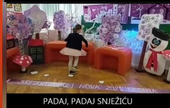
PADAJ, PADAJ SNJEŽIĆU