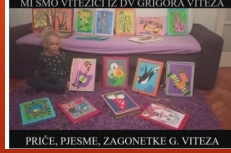
PRIČE, PJESME, ŽAGONETKE G. VITEZA