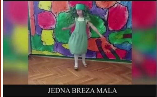
JEDNA BREZA MALA