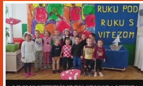
MI SMO VITEZIĆI IZ DV GRIGORA VITEZA